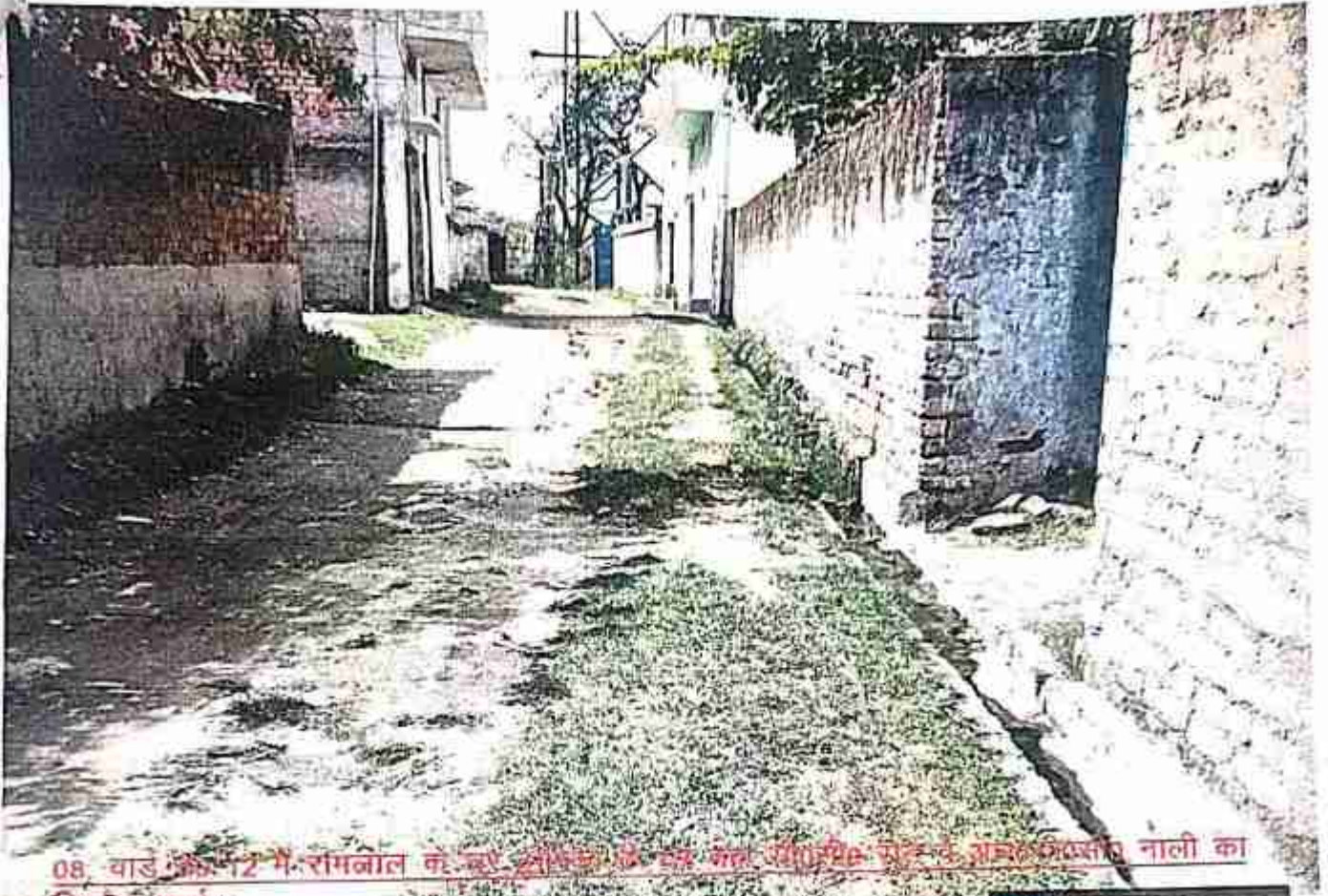
08. बाड़ क्षेत्र में रामनाल के लिए नाली का निर्माण कार्य।